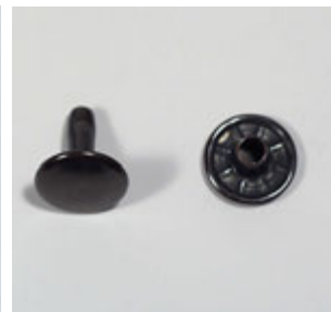
DOPPIA TESTA Double cap